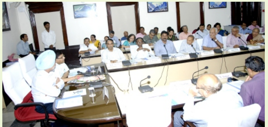
स्वैच्छिक संगठनों (वीओ) के साझेदारी कार्यक्रम की कार्यशाला