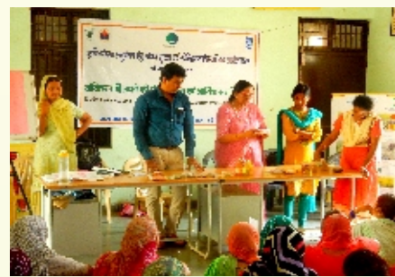
कृषि विज्ञान केन्द्र परिसर में 'डेरी फार्मिंग' पर व्यावसायिक प्रशिक्षण पाठ्यक्रम

संस्थान के शिकोहपुर स्थित कृषि विज्ञान केन्द्र ने अपने परिसर में 5 से 15 मई 2017 को 'डेरी फार्मिंग' पर 12 दिवसीय व्यावसायिक प्रशिक्षण पाठ्यक्रम आयोजित किया। इस प्रशिक्षण कार्यक्रम में गुरुग्राम जिले के 40 ग्रामीण युवाओं ने भाग लिया। इस कार्यक्रम का संबंध गोपशुओं तथा भैंसों की विभिन्न नस्लों, वैज्ञानिक प्रबंध, संतुलित आहार, रोग प्रबंधन, पशु बीमा, राज्य सरकार की विभिन्न कल्याण संबंधी योजनाओं तथा बैंकों द्वारा दी जाने वाली ऋण सुविधाओं से था जिनके बारे में प्रशिक्षण दिया गया। कृषि विज्ञान केन्द्र में 'खरीफ फसलों में समेकित नाशीजीव प्रबंध (आईपीएम)' पर सेवाकालीन कार्मिकों के लिए गुरुग्राम में दो प्रशिक्षण कार्यक्रम आयोजित किए गए : पहला 19 मई, 2017 को (हरियाणा कृषि विभाग के 18 एडीओ ने भाग लिया) तथा दूसरा 2 जून 2017 को (हरियाणा कृषि विभाग के 16 एडीओ ने भाग लिया)।