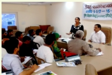
'बौद्धिक सम्पदा अधिकार एवं व्यवसाय' पर प्रशिक्षण कार्यक्रम

एफआर प्राधिकरण आदि), आईपी व्यवसायविदों द्वारा आईपीआर के मूलभूत विषयों के एटोर्नी, भौगोलिक संकेत एवं 'बासमती चावल' मुद्दा, पौधा किस्म और कृषक अधिकार संरक्षण अधिनियम के परिचय व व्यवसाय, पेटेंट प्रणाली, औद्योगिक डिज़ाइनों एवं ट्रेड मार्क के परिचय व व्यवसाय में इसके प्रभावों, आईपीआर और ट्रेड्स के विकास, स्वत्वाधिकार या कॉपीराइट अधिनियम के परिचय तथा व्यवसाय में इसके उपयोगों व प्रभावों, आईपी प्रबंध कार्यनीतियों तथा एसएमई की वृद्धि में आईपी की भूमिका और व्यवसाय विनियमन युग : कुछ मौलिक मुद्दों के अनुपालन जैसे विषयों पर व्याख्यान दिए गए।