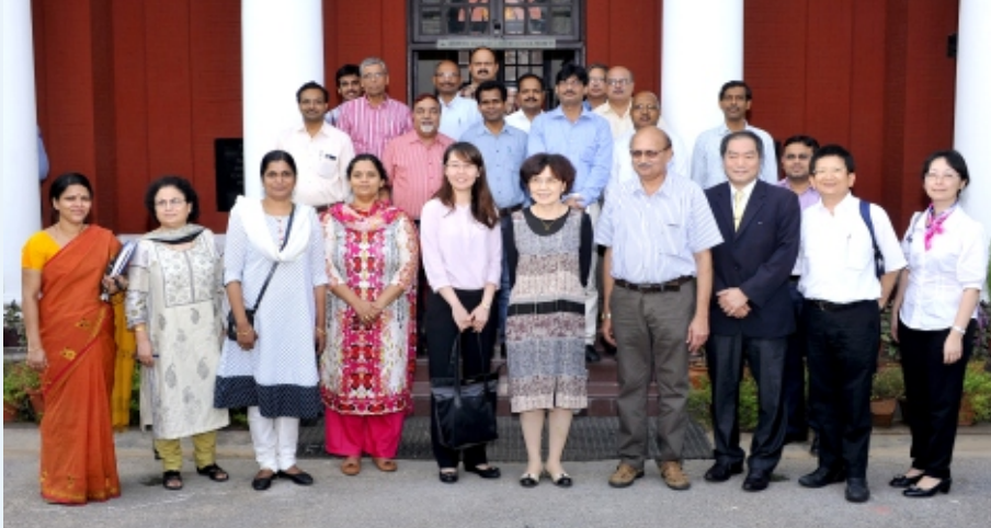
ताईवान का प्रतिनिधि मंडल भा.कृ.अ.सं. के दल के साथ