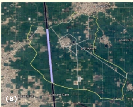
खजूरका ग्राम, हरियाणा में भागीदारीपूर्ण – जीआईएस (A) गुगल अर्थ छाया पर पटवारी मानचित्र और (B) डिजिटलीकृत ग्राम सीमा की छाया

क्यूजीआईएस (क्वांटम जीआईएस) प्रौद्योगिकी का उपयोग करके किया गया है जो एक क्रॉस-प्लेटफार्म ओपन-सोर्स डेस्कटॉप जीआईएस अनुप्रयोग है। गुगल अर्थ का उपयोग करके अध्ययन क्षेत्र को विरेखित किया गया और आधार मानचित्र तैयार किया गया। क्षेत्र में जल के वर्तमान तल तथा फसल विविधता को पुनः प्राप्त करने के लिए तथा प्राकृतिक संसाधनों के प्रबंध के संदर्भ में प्रक्रिया के बारे में निर्णयों को ग्रहण करने के लिए एक विशिष्ट समूह चर्चा आयोजित की गई। ग्रामवासियों से मानचित्र पर विभिन्न स्थानों पर उगाई गई फसलों, मृदा के प्रकार, क्षेत्र के ढलान, नलकूपों की स्थिति आदि के बारे में पहचान करने व पता लगाने के लिए कहा गया। गांव के मुखिया द्वारा पटवारी मानचित्र दिए गए तथा उन्हें आधार मानचित्र पर सुपर इम्पोज़ करते हुए गांव की सीमा को डिजिटलीकृत किया गया।