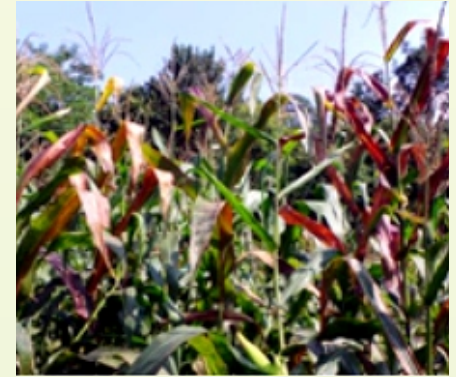
मक्का के पत्ती लालिमा रोग से संक्रमित फसल

सिओट, जम्मू एवं कश्मीर में सितम्बर 2016 के महीने में मक्का की फसल के पौधों की पत्तियों पर लालिमा रोग का 10–15 प्रतिशत प्रकोप देखा गया। 16S rDNA क्रम पर आधारित मक्का की संक्रमित पत्तियों के नमूने के आण्विक लक्षण-वर्णन और आभासी आरएफएलपी पैटर्न से मक्का की पत्ती के लालिमा रोग की फाइटोप्लाज़्मा के साथ संबंधित होने की पुष्टि हुई। इस रोगजनक की कैंडीडेटस फाइटोप्लाज़्मा एस्टेरिस उपसमूह बी के प्रभेद के रूप में पहचान की गई। यह भारत में मक्का की फसल में पत्ती लालिमा रोग उत्पन्न करने के मामले में सीए. पी. एस्टेरिस (16SrI-B) की सम्बद्धता की प्रथम रिपोर्ट है।