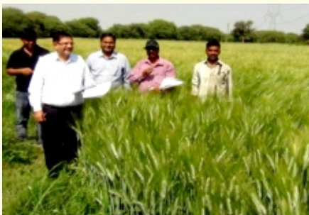
मकोदिया गांव (एमजीएमजी) में एचआई 8713 (पूसा मंगल) का प्रक्षेत्र प्रदर्शन

गांवों में 13.8 हैक्टर क्षेत्र में गेहूं की नई किस्मों के 28 अग्र पंक्ति प्रदर्शन आयोजित किए। सकल औसत उपज वृद्धि 2 टन/है. थी। किसानों ने सीमित सिंचाई की दशाओं के अंतर्गत भा.कृ.अ.सं. की गेहूं की किस्मों की 4.5 टन/है. उपज तथा सुनिश्चित सिंचाई के अंतर्गत 6.9 टन/है. उपज प्राप्त की। पोषणिक सुरक्षा बढ़ाने के लिए इन गांवों के 8 हैक्टर क्षेत्र में ड्यूरम गेहूं की 5 किस्मों के 15 अग्र पंक्ति प्रदर्शन आयोजित किए गए।